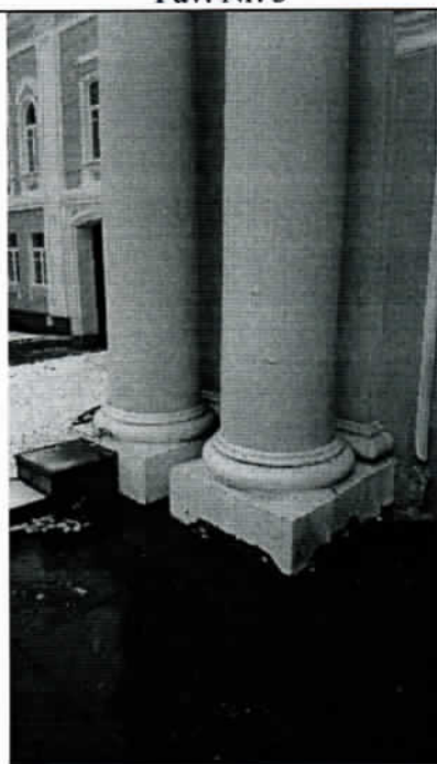
Pav. Nr. 5