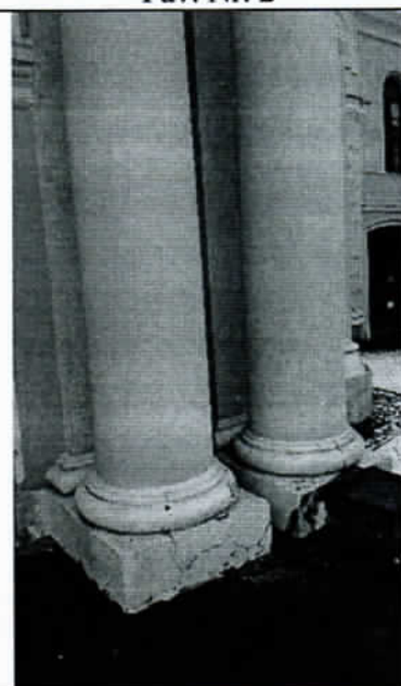
Pav. Nr. 4