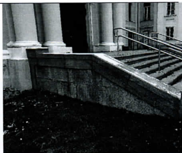
Pav. Nr. 2