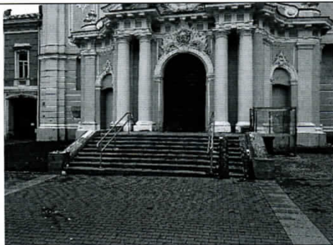
Pav. Nr. 1