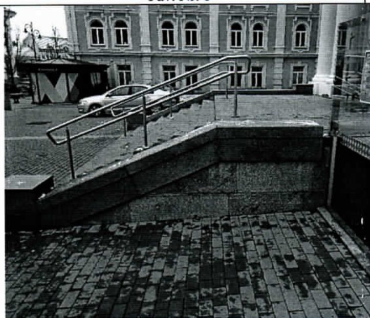
Pav. Nr. 3